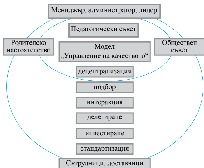
Организационно-управленска структура в педагогическата институция

В мотивираща и креативна среда педагогическите екипи споделиха концепции, реализирани проекти, иновативни практики, педагогически технологии за формиране на ключови компетентности в интерактивно образователно пространство.