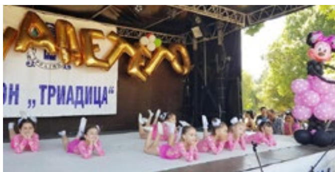
Гимнастическа композиция – подготвителна 6 „б“ група