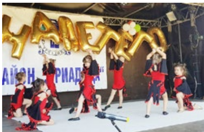
Латино танц „Пасо добле“ – подготвителна 5 „б“ група.